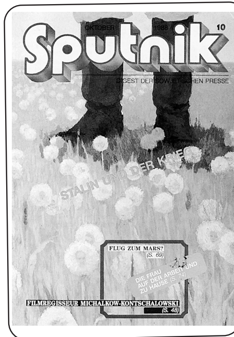
TITELBLATT DES LETZTEN IN DER DDR ERSCHEINENEN „SPUTNIK“ VOM OKTOBER 1988.

Nach Jahrhunderten des Analphabetentums in großen Teilen der Bevölkerung, nach mühsamen handschriftlichen Vervielfältigungen von Texten brach mit der Erfindung des Buchdrucks durch Gutenberg um 1445 ein neues Zeitalter an. Vergleichsweise rasend schnell konnten Handzettel, Flugblätter und Bücher mit neuem, brisantem Gedankengut vor allem zu Fragen der Theologie und Philosophie, aber auch zu naturwissenschaftlichen Themen verbreitet werden. Erste Zeitungen entstanden, immer mehr Menschen konnten zumindest in Ansätzen lesen. Staat und Kirche sahen ihre Macht, ihr Weltbild ins Wanken geraten. Wessen Meinung nicht passte, der musste mit drastischen Strafen rechnen. Mit den Ideen der französischen Revolution verbreitete sich die Forderung nach Meinungs- und Pressefreiheit in ganz Europa und im Deutschen Reich. Aber es sollte noch 150 Jahre dauern, bis im ersten deutschen Grundgesetz die Meinungsfreiheit verankert wurde. Und noch einmal 40 Jahre, bevor dieses Grundgesetz in ganz Deutschland galt.